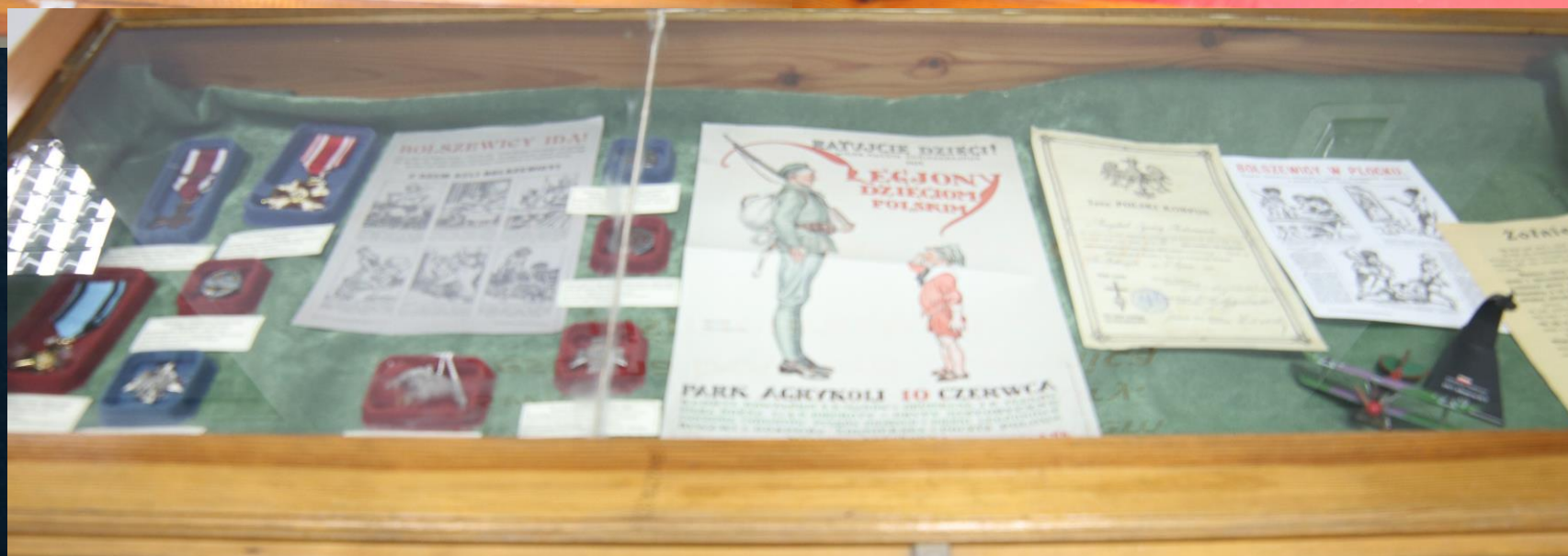
W holu czekała na gości wystawa przygotowana przez Włoszczowskie Towarzystwo Historyczne związana z okresem, kiedy Polska znajdowała się pod zaborami