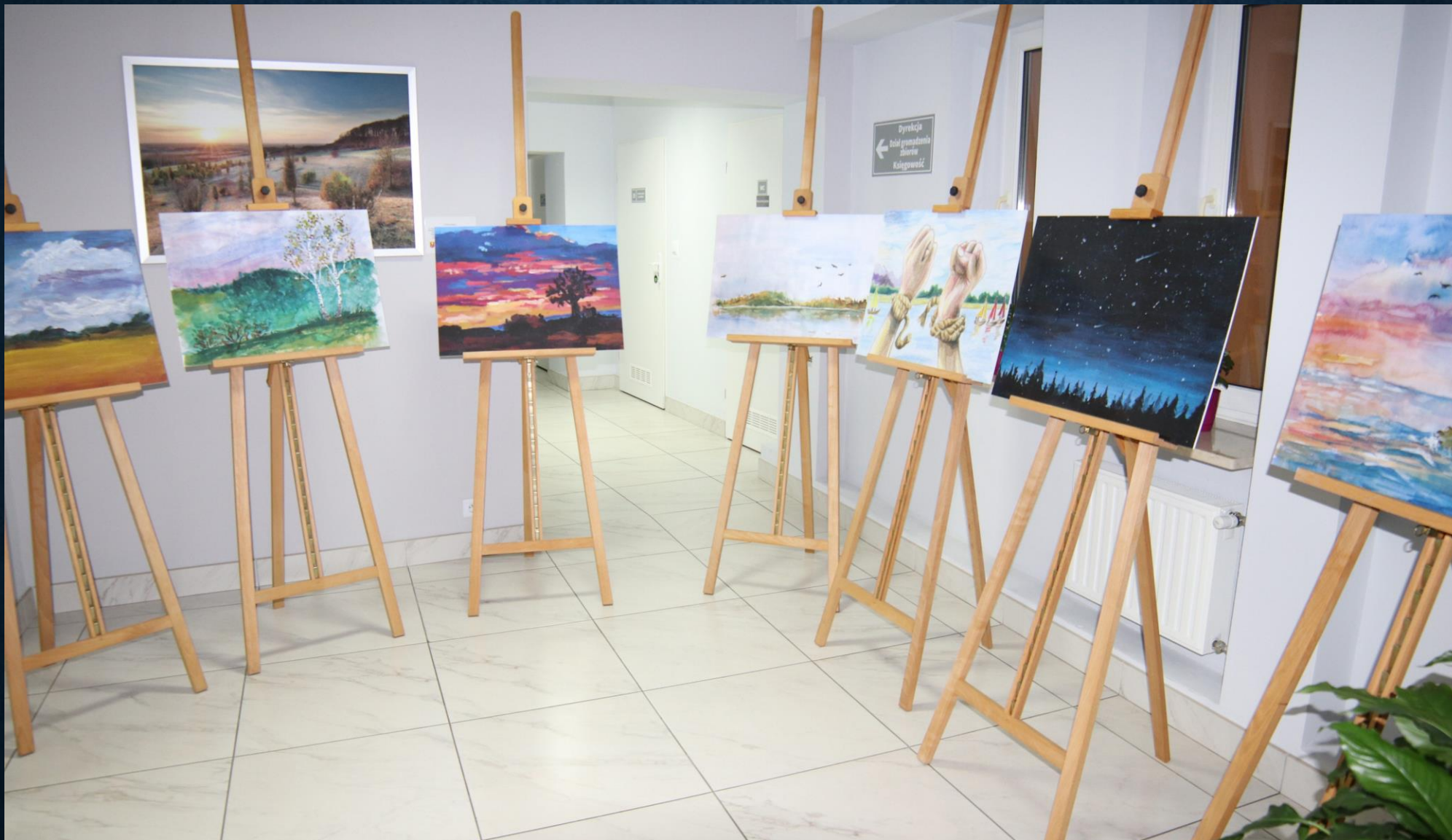
Na piętrze biblioteki goście mogli oglądać wystawę malarstwa młodzieży „Pejzaże wolności”